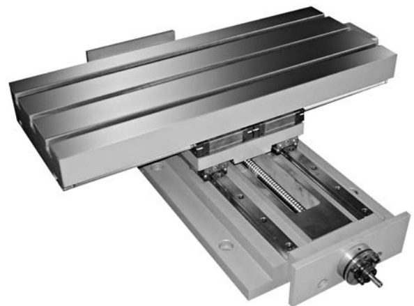
Automatica Automatique Automatic Automatisch

Mesas en cruz de dos ejes y largo desplazamiento. Esta serie de mesas se distinguen por su gran longitud de desplazamiento en los dos ejes. El carro transversal va protegido con fuelles especiales como defensa de las guías de desplazamiento. Se fabrican dos modelos LT-600 (Recorridos 350x300) y LT-800 (Recorridos 470x470). También pueden suministrarse bajo pedido mediante sistema CNC.