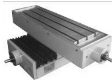
Semi-mecanizados & acabados Fresado, taladrado, roscado, grabado, rectificado... Sub-montajes de elementos