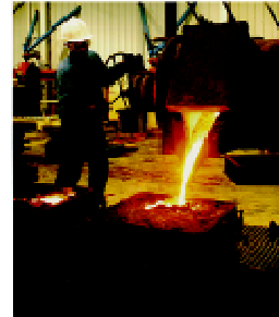
Fundición de hierro colado (laminar y nodular): GG 20-25-30 & GGG 40-50-60