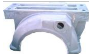
Hasta piezas de 3500 Kg